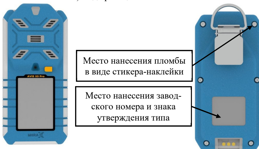
д) модификация AVIS X5 Pro