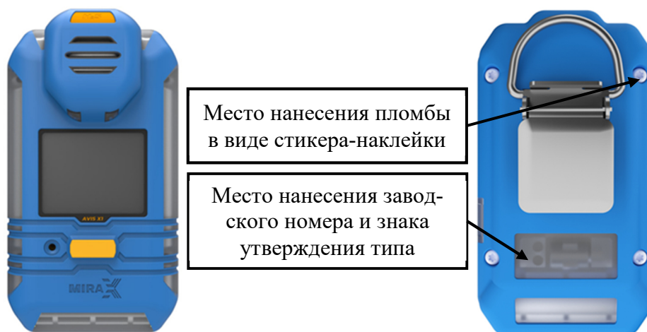
а) модификация AVIS X1