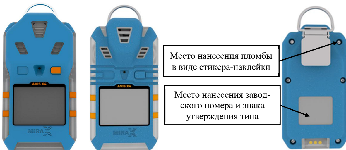
в) модификация AVIS X4