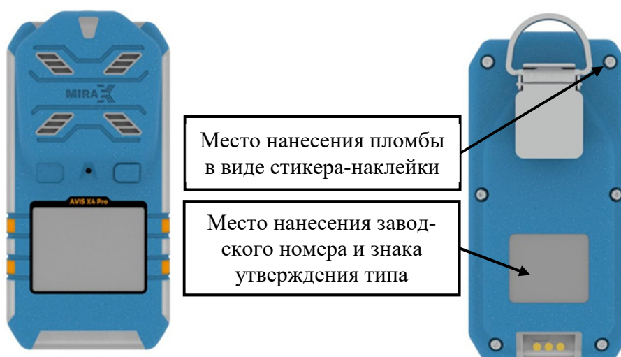
г) модификация AVIS X4 Pro